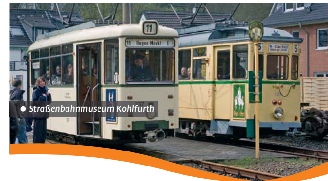
• Straßenbahnmuseum Kohlfurth