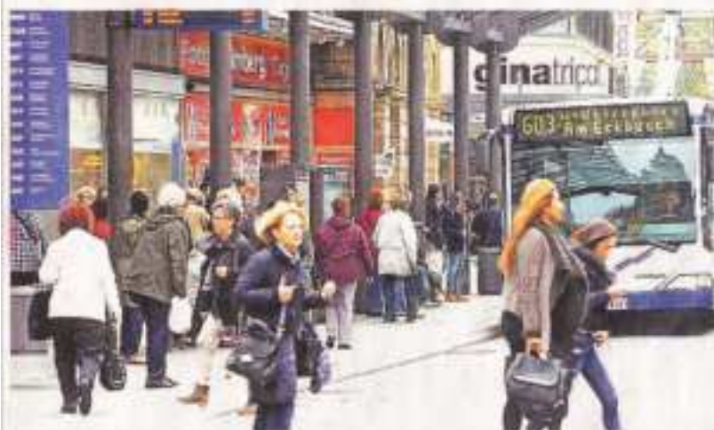
Auch auf dem Wall wird am Sonntag einiges los sein, wenn die Geschäfte geöffnet sind. Der Einzelhandel bittet zum Einkaufsbummel.