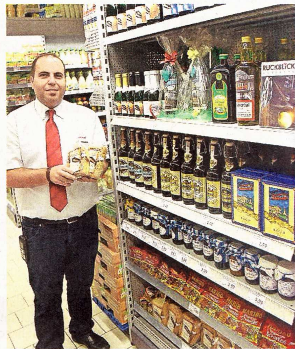
Den Kaisertwagen als Weihnachtskugel gibt es für 19,95 Euro bei der Wuppertal Touristik im City Center. Im Akzenta (rechts) gibt es Wuppertal-Lebensmittel ab 99 Cent