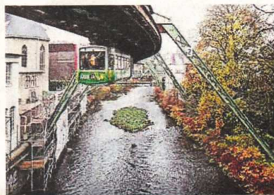
Einige Führungen drehen sich um die Wupper.