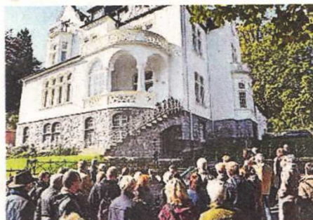
Eine Führung geht auch durch das Briller Viertel.