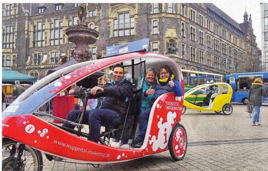
Mit dem Velotaxi kann man entspannt die Stadt erkunden und so manche Entdeckung machen.

Übrigens ist die mobile Tourismusinfo, die am 22. Mai auf der WZ-Autoschau präsentiert wird, auch auf der Nordbahntrasse unterwegs. Umweltfreundlich und nachhaltig geht es aber auch mit dem Auto.