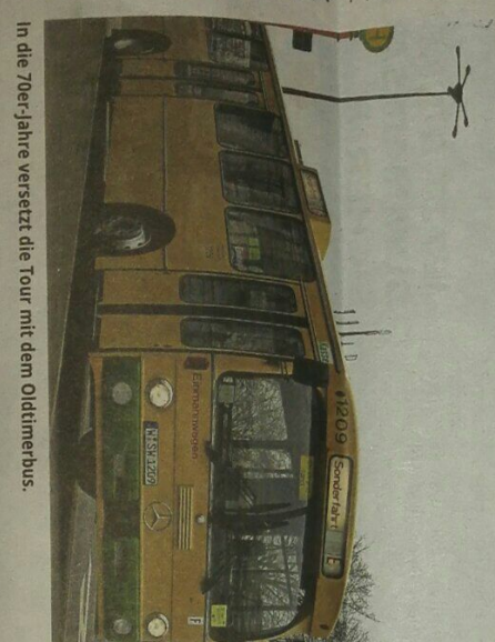
In die 70er-Jahre versetzt die Tour mit dem Oldtimerbus.

Velotaxi, das den Aufdruck der Wuppertal Marketing GmbH trägt und als rollende Touristenformation auf der Nordbahntrasse unterwegs ist. Für die Fahrgäste ist es ein ganz besonderes Transporterlebnis, unumweltfreundlich eine Tour zu Wuppertals touristischen Highlights zu unternehmen.