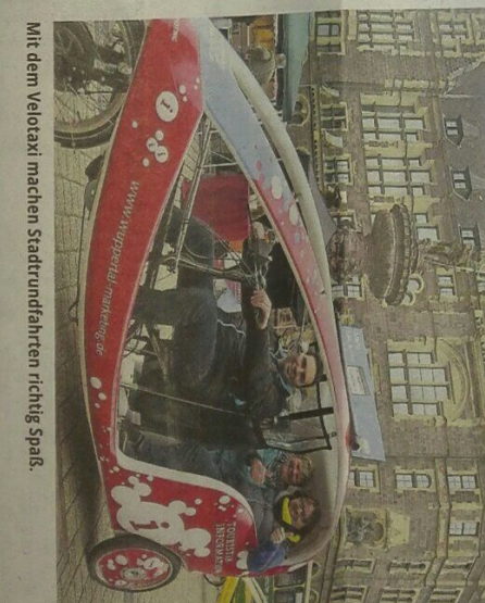
Mit dem Velotaxi machen Stadtrundfahrten richtig Spaß.

Saison für das Velotaxi ist von April bis Oktober, an Wochenenden, Feiertagen und Bräuhelgen. Die Kapazität beträgt zwei Erwachsene und ein Kind bis zu sieben Jahren. Geboren werden Sigtseeing-Touren in Elberfeld von 60 bis 120 Minuten Dauer sowie auf der Nordbahntrasse von 60 bis 180 Minuten.