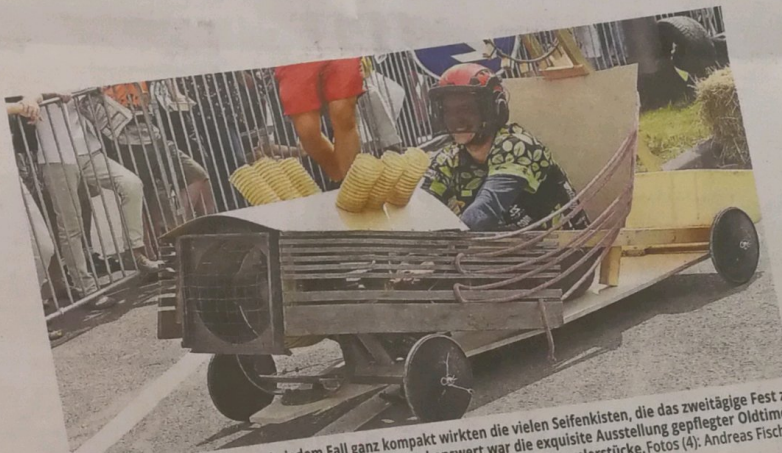
Ausgefallen, originell und nicht in jedem Fall ganz kompakt wirkten die vielen Seifenkisten, die das zweitägige Fest zu einem besonderen Spaß werden ließen. Nicht weniger sehenswert war die exquisite Ausstellung gepflegter Oldtimer: Darunter präsentierten sich Autofans viele Raritäten und besonders schöne Sammlerstücke.