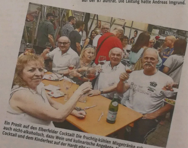
Ein Prost auf den Elberfelder Cocktail! Die fruchtig-kühlen Mixgetränke gab es natürlich auch nicht-alkoholisch, dazu Wein und kulinarische Angebote. Noch mehr zum Elberfelder Cocktail und dem Kinderfest auf der Hardt gibt es auf Seite 19.