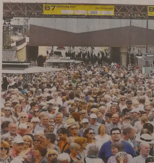
Viele Besucher „unter“ dem Döppersberg: Die Bundesstraße ist nun tiefergelegt, die Fußgängerbrücke führt von der Alten Freiheit zu Mall und Hauptbahnhof.