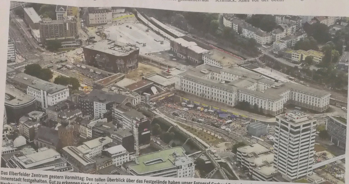
Das Elberfelder Zentrum gestern Vormittag: Den tollen Überblick über das Festgelände haben unser Fotograf Gerhard Bartsch und Pilot Frank Busche bei einem Rundflug über die Innenstadt festgehalten. Gut zu erkennen sind der Sparkassenturm rechts, links daneben die Partymeile mit Bühne. Im oberen Bildteil sind von links nach rechts Kaiserhof, Primark-Neubau, Hauptbahnhof mit Brücke zur Südstadt und der helle Komplex der ehemaligen Bundesbahndirektion gut zu sehen.

» Um drei Uhr heute Nacht wurde die B7 für den Autoverkehr freigegeben, wir berichten online und in der morgigen Ausgabe.