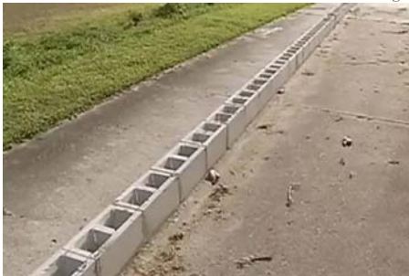
[Fotos] Nachbar eines älteren Mannes blockierte seine Einfahrt, er reagiert auf die... Fribbla.de