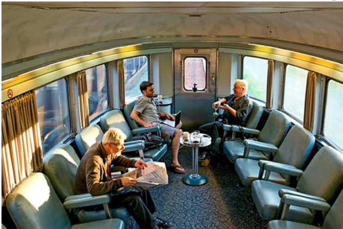
Kanada: Mit dem Zug die wunderbare Wildnis durchqueren LONELY PLANET