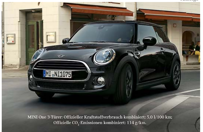
MINI One 3-Türer: Offizieller Kraftstoffverbrauch kombiniert: 5,0 l/100 km; Offizielle CO 2 -Emissionen kombiniert: 114 g/km.