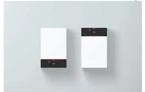
Moderne Heizung ohne Anschaffungskosten. Rundum-sorglos heizen - ab 72,- Euro... Viessmann